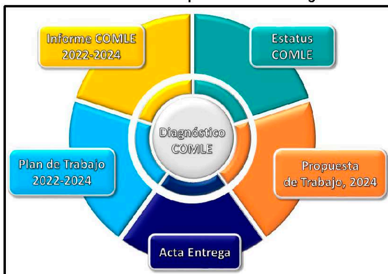
Figura No. 1. Elementos fundamentales para elaborar el diagnóstico.

El diagnóstico se construyó considerando cinco elementos fundamentales: (1) Informe del Colegio 2022-2024 presentado por la anterior Directiva en la Asamblea General, que contiene datos relevantes sobre la situación institucional durante ese período; (2) Estatutos COMLE, que definen la Misión, Visión, Objetivos y Facultades normativas que guían la dirección del Colegio; (3) Propuesta de Trabajo 2024-2026, delineada por la nueva Directiva y que refleja las necesidades y prioridades institucionales a largo plazo; (4) Acta de Entrega, que identifica los temas críticos pendientes de resolución inmediata por parte de la nueva Directiva; y (5) Plan de Trabajo 2022-2024, que reintegra las mejores prácticas de años anteriores y define acciones estratégicas para el desarrollo continuo y la mejora del Colegio (Figura No. 1).