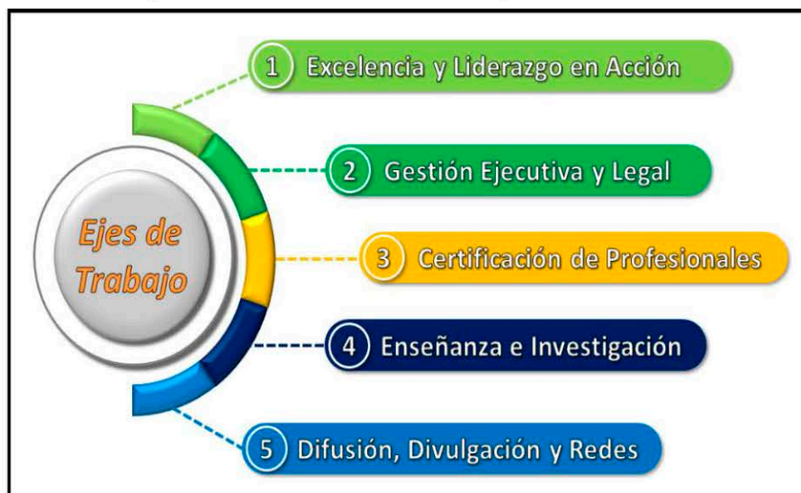
Figura No. 2. Ejes Rectores del Plan de Trabajo 2024-2026

Los proyectos son acciones operativas que materializan las líneas programáticas. Están orientados al diseño, implementación y evaluación de las iniciativas desarrolladas, asegurando una planificación efectiva y un seguimiento riguroso en cada etapa del proceso.